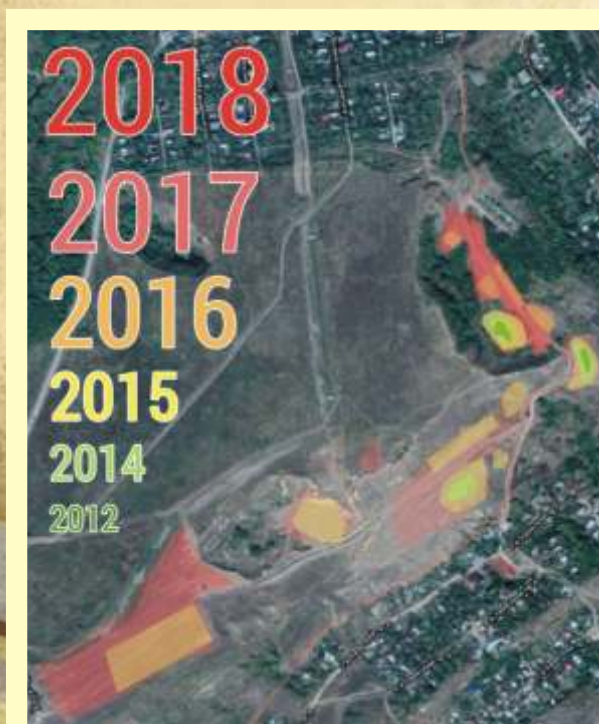
Схема фестивальных площадок